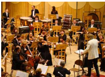
BANDES I ORQUESTRES